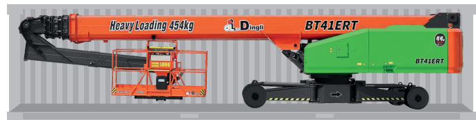
Transporte en contenedores estándar