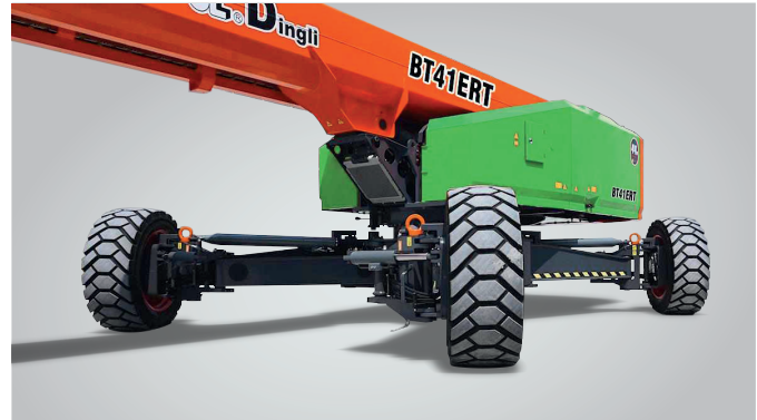
Extensión de ejes en el mismo sitio Protección mundial de patentes