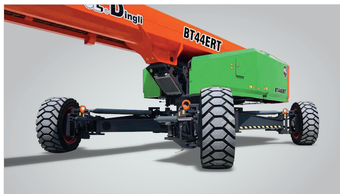
Extensión de ejes en el mismo sitio Protección mundial de patentes