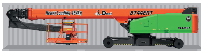
Transporte en contenedores estándar