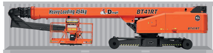
Transporte de contenedores estándar.