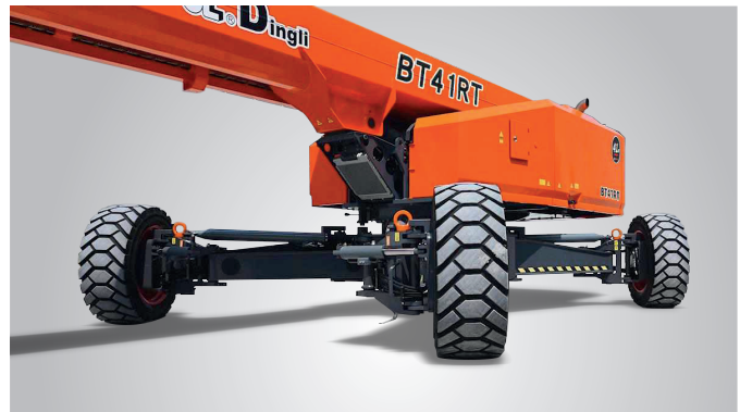
Nueva tecnología de expansión de eje in situ con un solo botón.